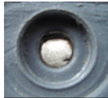
Con GRIP si eliminano i crateri